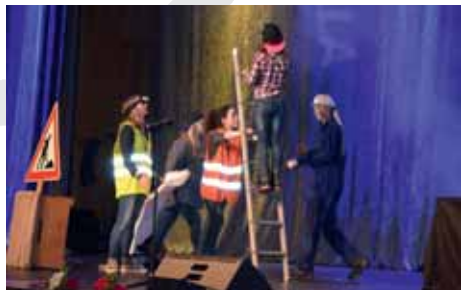
Unsere neue Bewegungstheatergruppe „Young motion“ auf der Sportgala

Neben dem finanziellen Gewinn ist trotz der vielen Arbeit für uns die Veranstaltung durch die enorme Hilfe von so vielen von Euch ein besonderes und schönes Erlebnis gewesen, in diesem Sinne noch einmal vielen Dank an all die Unterstützer im Vorfeld, während der Gala und beim lästigen Aufräumen.