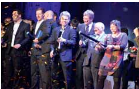
Der MTV sorgt für den Konfettiregen zum Abschluss der Sportgala

Dank vieler Sponsoren konnten wir eine gut bestückte Tombola präsentieren, und allein mit dem Losverkauf einen Gewinn von knapp 2000 Euro erzielen. (Der Gesamterlös der Veranstaltung wird uns leider erst nach Redaktionsschluss bekanntgegeben und überreicht.)