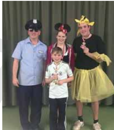
Die Sieger des Pappnasenturnier

Für die tolle Organisation und die Pokalauswahl war wie immer unser Sportwart Tobi verantwortlich. Vielen Dank für das erste Turnier in diesem Jahr, wir freuen uns auf mehr !